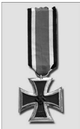
II klasės Geležinis kryžius