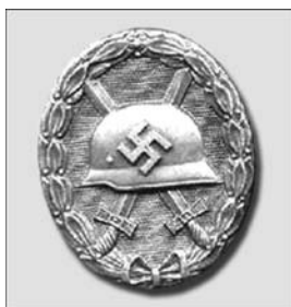
III kategorijos Sužeidimo ženklas