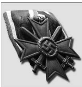
II klasės Karo kyžius su kardais