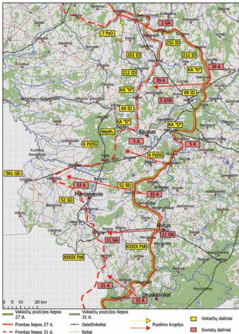
7 žemėlapis. Kauno puolamoji operacija liepos 27–31 d. Nubraižyta autoriaus pagal: ЦАМО, ф. 500, он. 12466, д. 86; Ф. 241, он. 2593, д. 332.; Ф. 235, он. 2074, д. 848