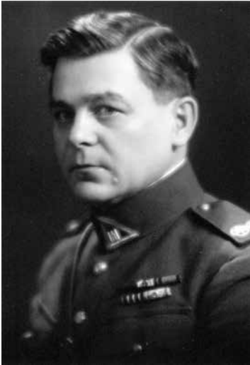
Plk. Itn. Vytautas Steponaitis